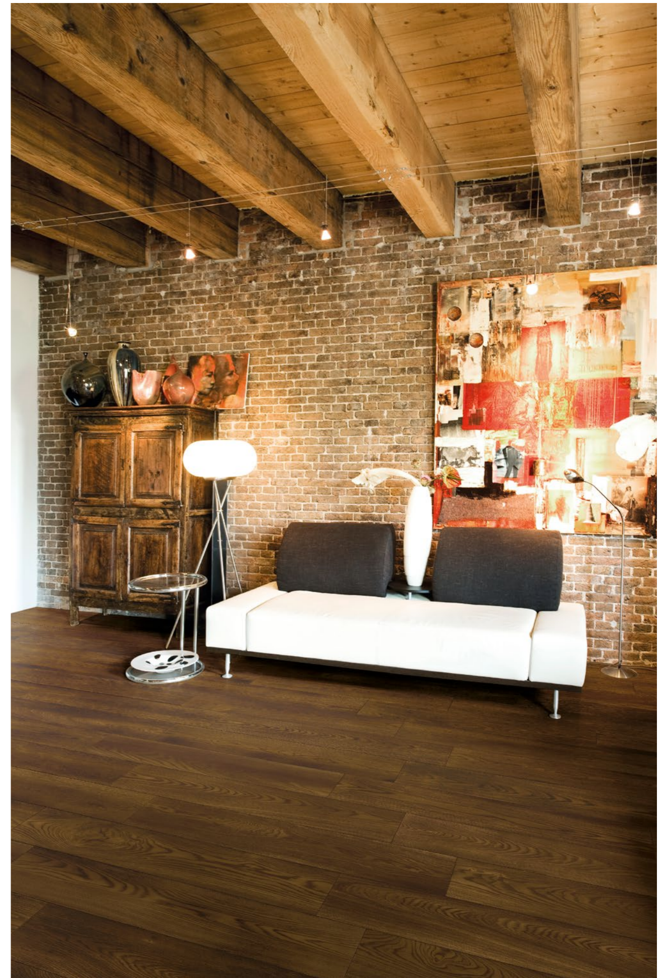
Noce Cerato Rett. 20x120 - 77/8" x 47 1/4"