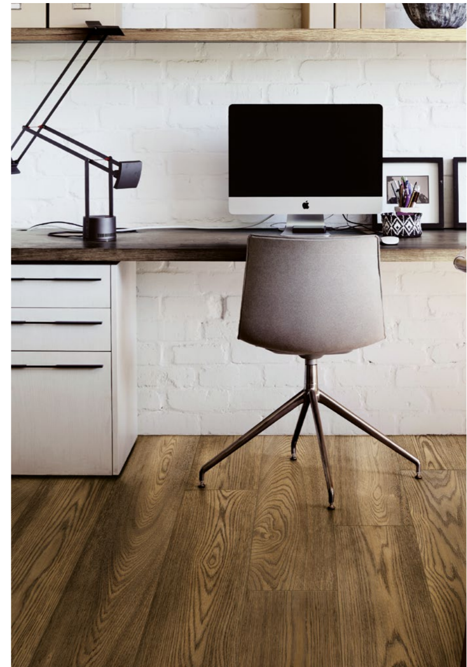
Rovere Cerato Rett. 20x120 - 7 7 / 8 "x47 1 / 4 "