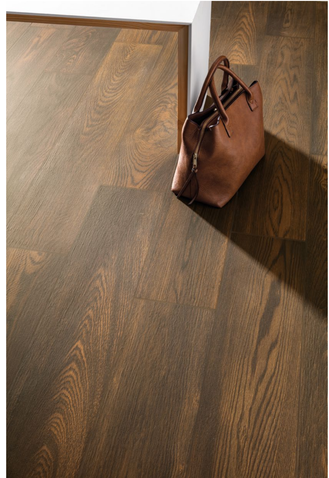
Noce Cerato Rett. 20x120 - 77/8" x 47 1/4"