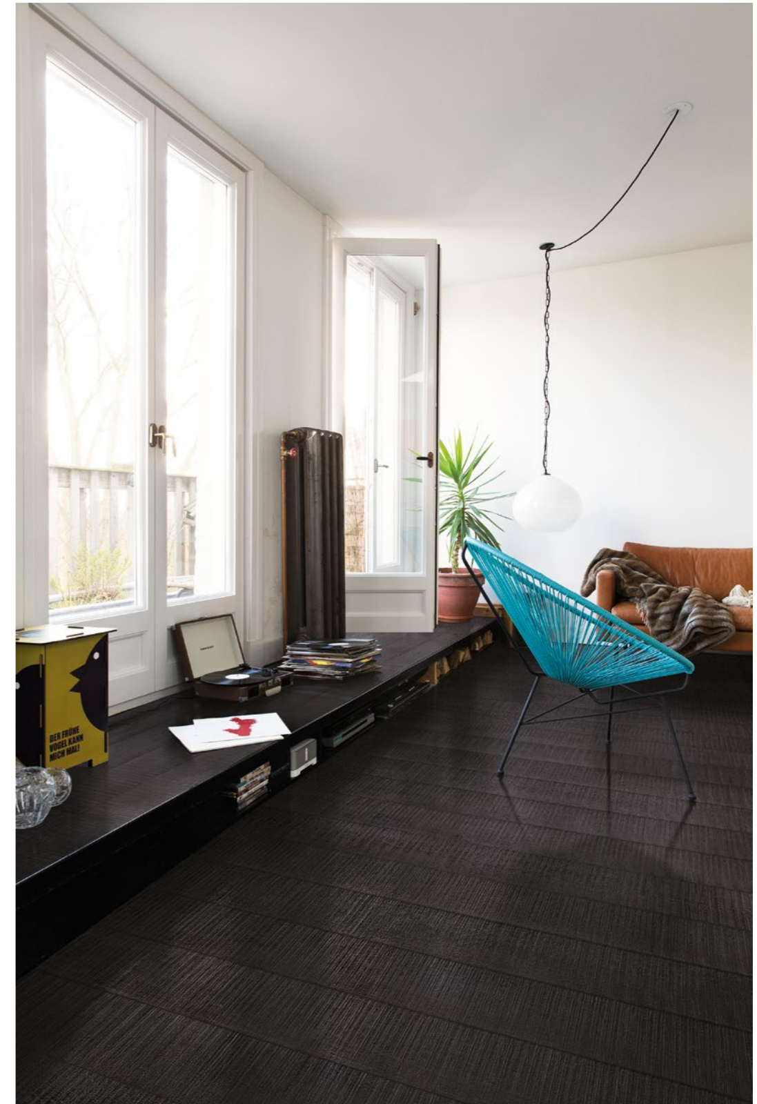
Nero Laccato Rett. 20x120 - 77/8"x47 1/4"