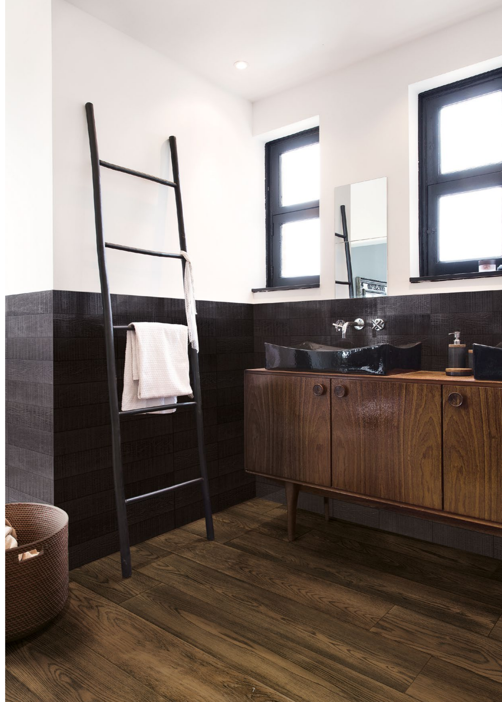
Rovere Cerato Rett. 20x120 - 7 7 / 8 "x47 1 / 4 "