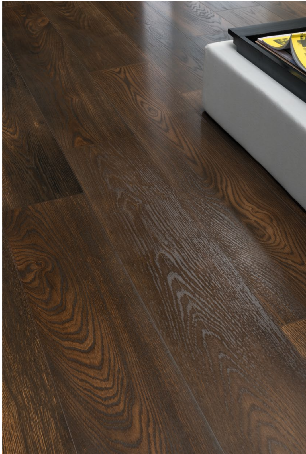
Noce Cerato Rett. 20x120 - 77/8" x 47 1/4"