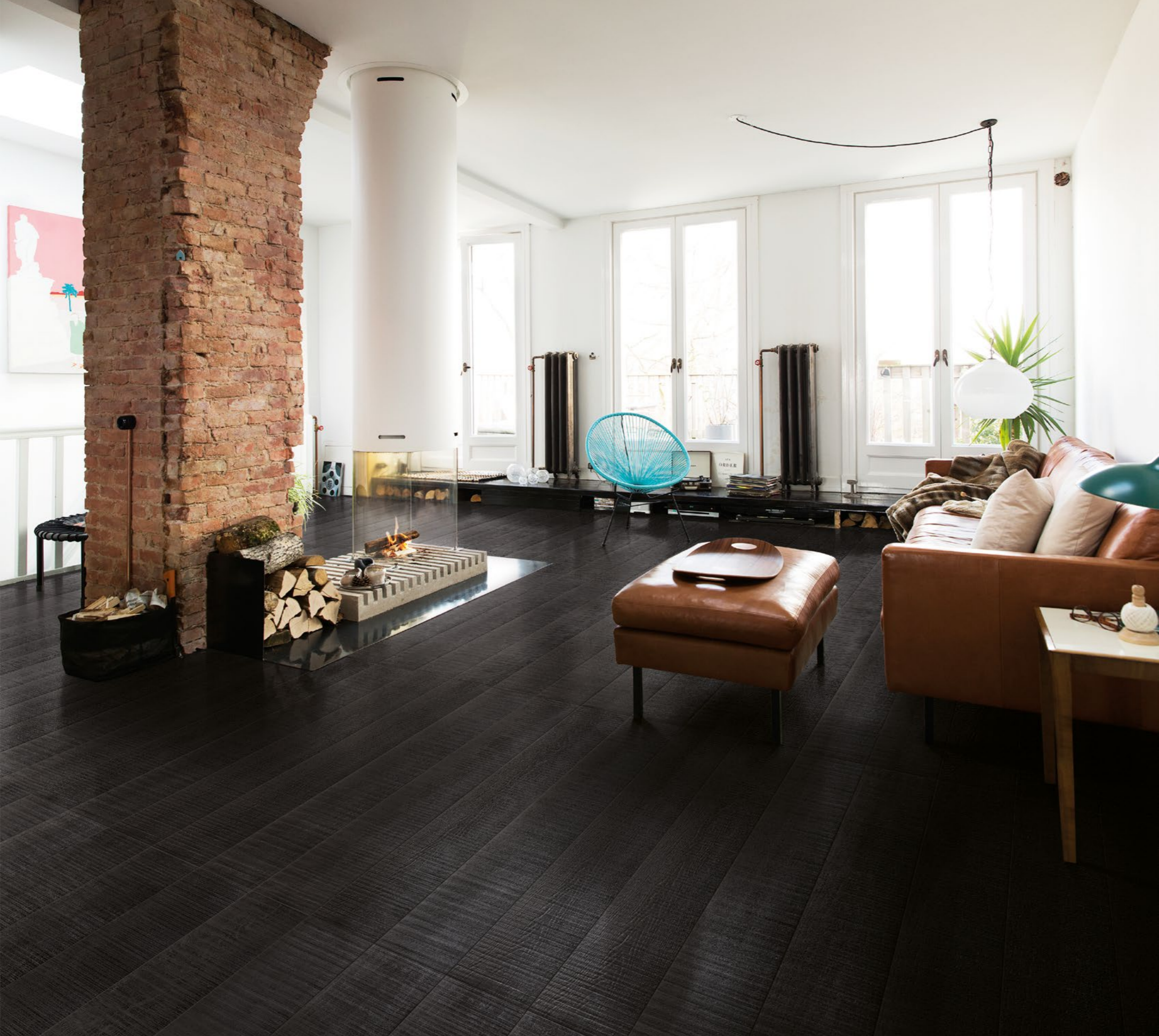
Nero Laccato Rett. 20x120 - 7 7 / 8 "x47 1 / 4 "