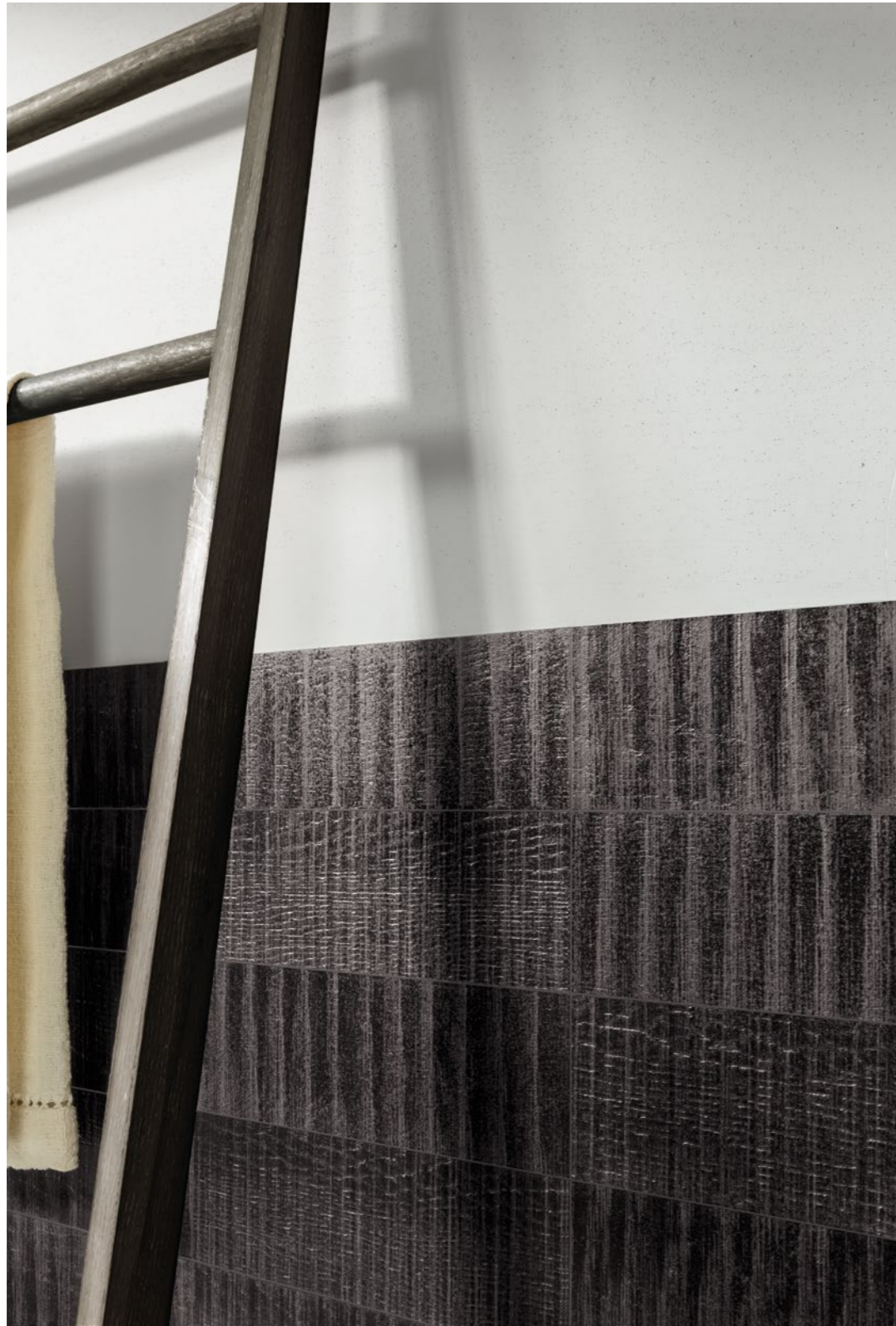
Brick Nero Lacc. Rett. 10x30 - 3 15 / 16 "x11 13 / 16 "